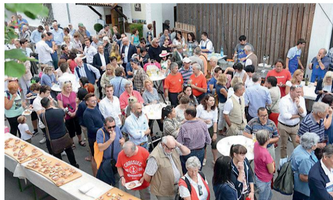
La festa tenutasi ieri al Colle

terrottamente da più di un secolo e si propone come l'alternativa non consumistica e non inquinante a tutti gli altri mezzi. Piedi esclusi. Tutti si sono comunque mobilitati. La società della Funivia, il Comune di Bolzano, l'Azienda di soggiorno. I