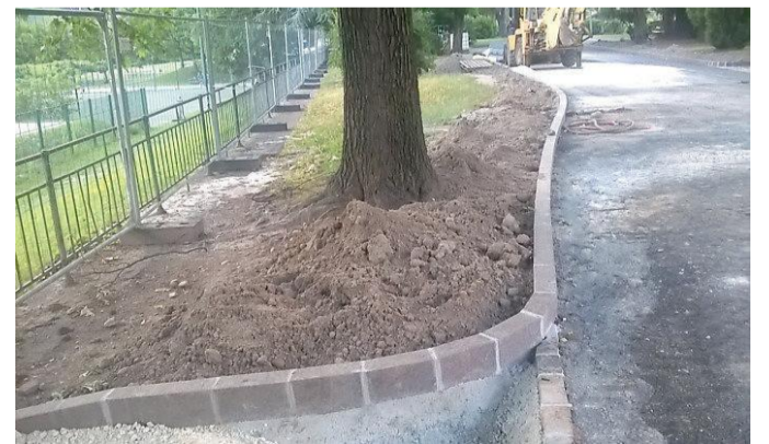
I lavori eseguiti lungo le passeggiate del Talvera

I Cinque Stelle, in un'interrogazione in cui chiedono lumi su come sono stati esegui-