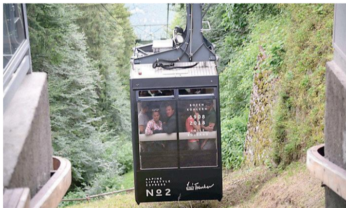
Una delle due cabine attuali, con la scritta 1908-2018