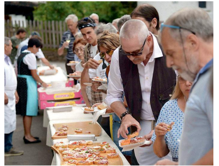
Ieri tanti bolzanini per la festa della funivia del Colle