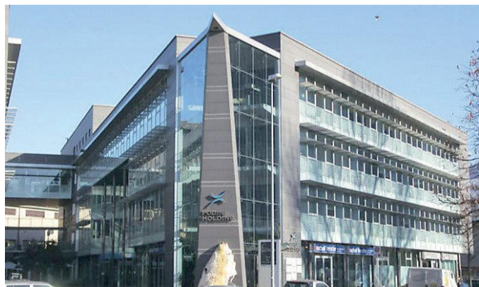
La sede della Podini Holding